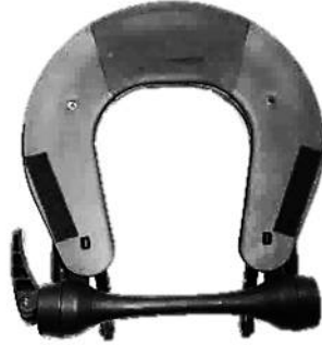
フレックスレスト