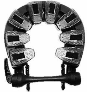
カレスフェイスクレドル