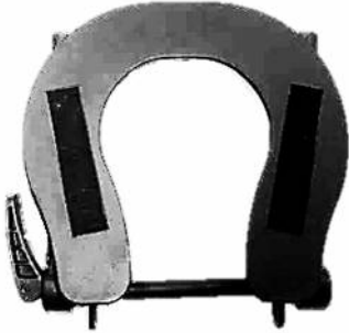
デラックスアジャスタブル